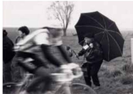
LE TAILLEUR DE SONS