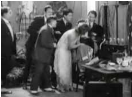
PARIS QUI DORT